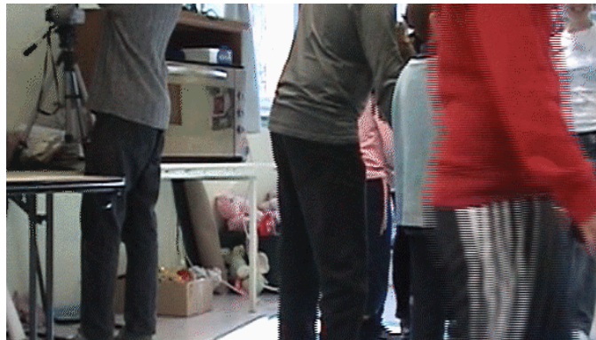
Peter Pan – 2006 – Com'étéK diffusion

« Ateliers d'initiation à la création vidéo » : des dossiers de proposition sont déposés dans différents établissements scolaires et municipaux à Marseille, à Aubagne et à Miramas. Des plaquettes de présentation ont été distribuées.