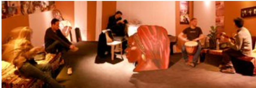
Festival International du Film - 2007 - InternExterne/Com'étéK diffusion

« Oreille Interne » : une installation multimédia imaginée avec l'association InternExterne. Une résidence de travail au Afriki Djigui Theatri à Marseille a permis d'évoluer sur cette proposition et de concrétiser des montages vidéos et sons. L'installation au Festival International du Film d'Aubagne a permis d'améliorer sa matérialisation.